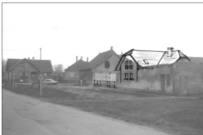
A köz az iskola felől az 1980-es évek végén