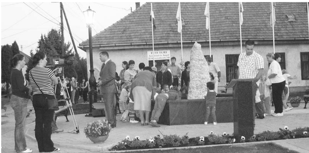
Miénk a Tér