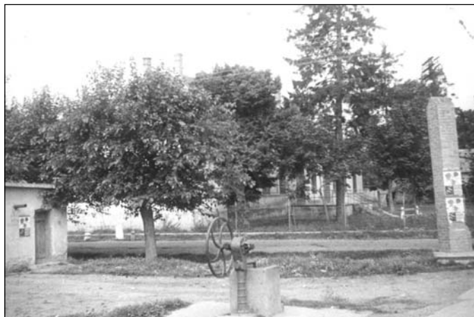
A köz az 1940-es évek végén