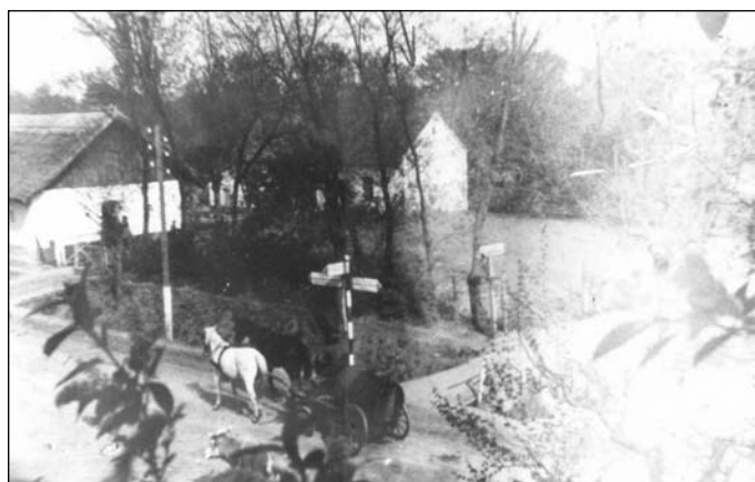
A köz a Tschurl kúria padlásáról fényképezve

Impresszum: Enesei Hírmondó. Kiadja: Polgármesteri Hivatal, Enese. Megjelenik: negyedévente 650 példányban. Felelős szerkesztő: Mesterházy József. Nyomdai előkészítés és nyomás: Wasco Trade Kft., Győr, Viza u. 4., Tel.: 96/517-793, Fax: 96/517-794