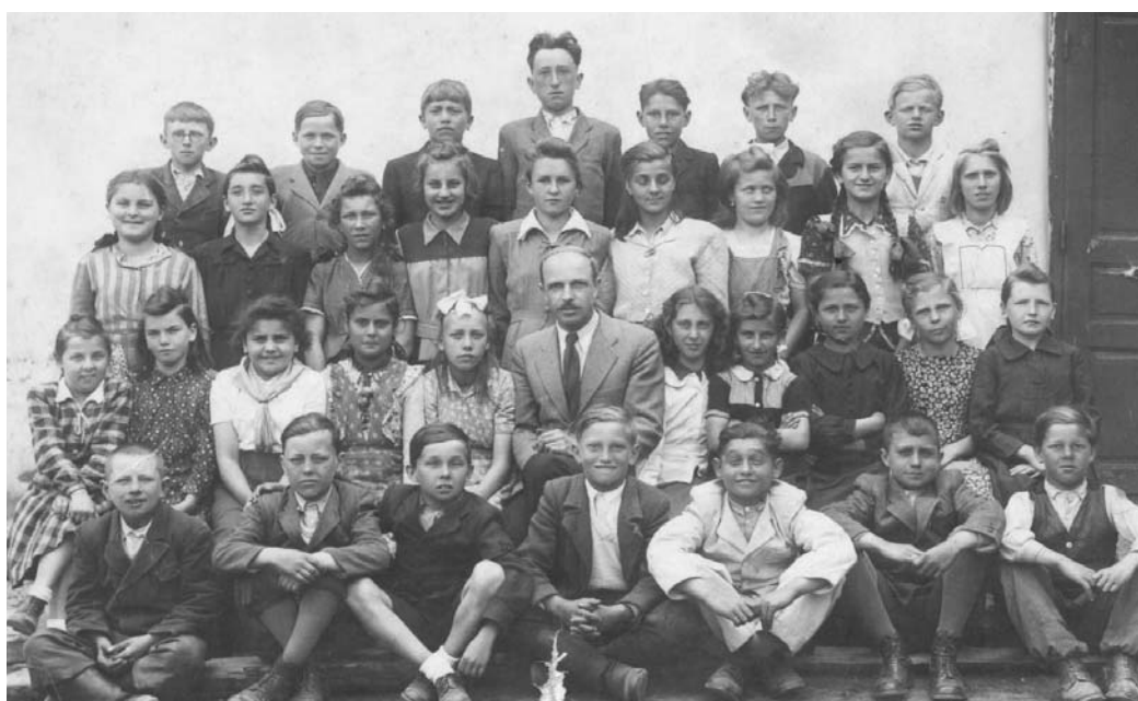
5-6. osztály 1949-ben.