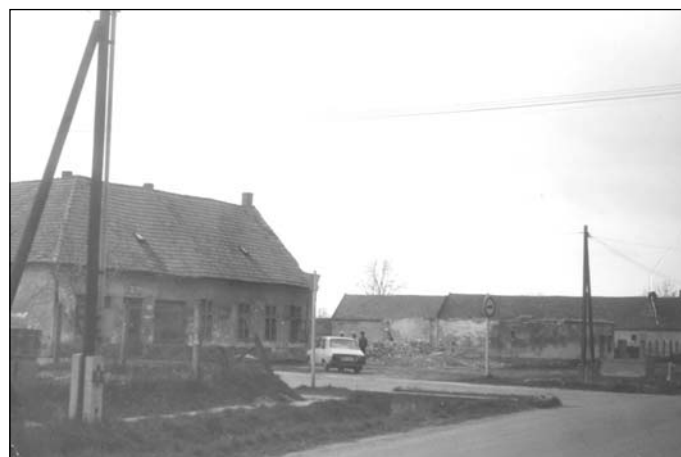
A köz a Fregatt felől az 1980-as évek végén Varga István (Szabadság utca) fényképe