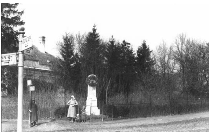
A Hősök szobra az I. világháború után