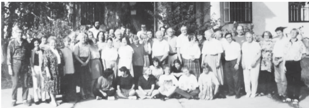
Az első zenekari kurzus (1993. július 17-25-ig) csoportképe