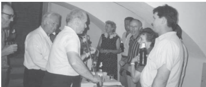
A kultúrház pincéjében az 1990-es évek közepén

Május elsején jártuk a falut, énekeltünk. Enesei búcsúkor a „cés legények” eljárták a verbunkot a katolikus templom előtt. Mi muzsikáltunk nekik. Délutántól már a búcsúban húztuk a talpalávalót. Elsősorban régi magyar nótákat játszottunk.