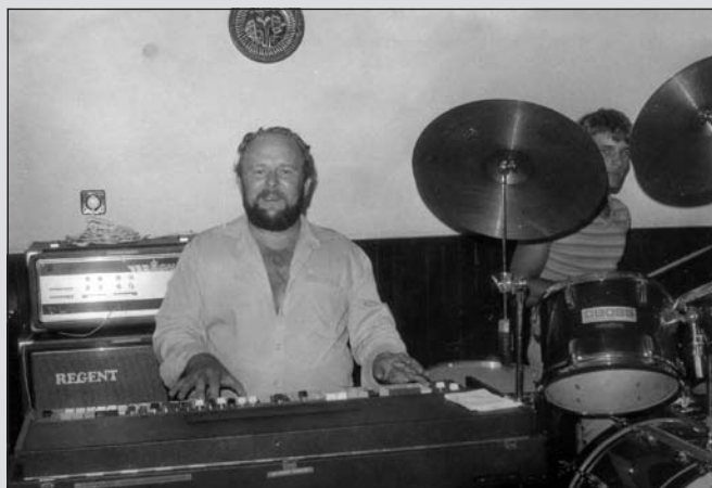
A billentyűk mögött