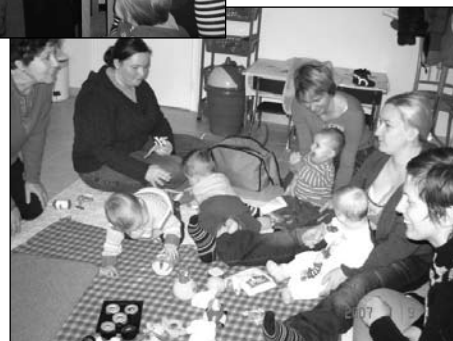
Anyukák, kisbabák és a Védőnő