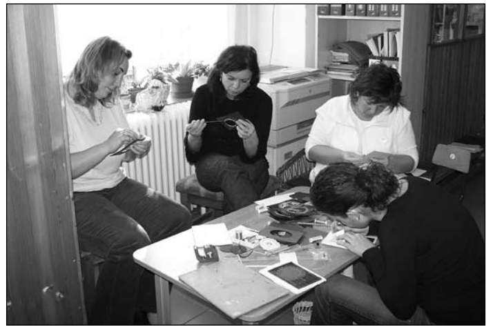
Képeslap varrás az oviban