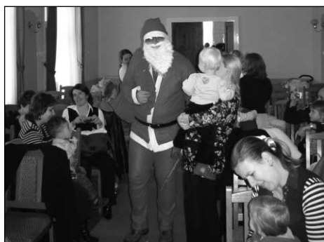
Mikulás a Baba-mama klubban