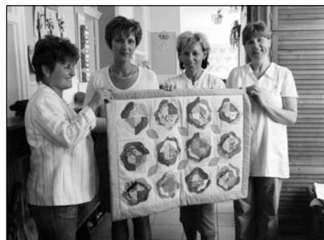
Ajándék az óvodának