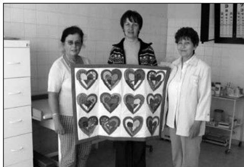
Ajándék az egészségháznak