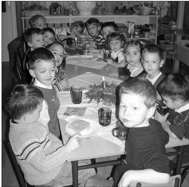
Kiscsoportosok karácsonyi tízóraiása