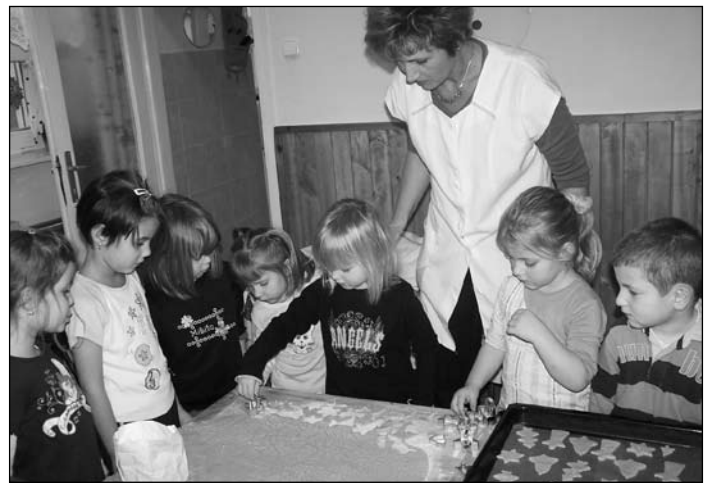
Készítik az ovisok a mézes süteményt