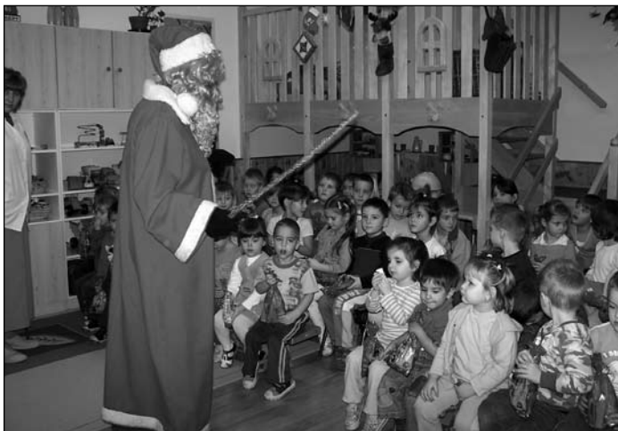
Mikulás az oviban