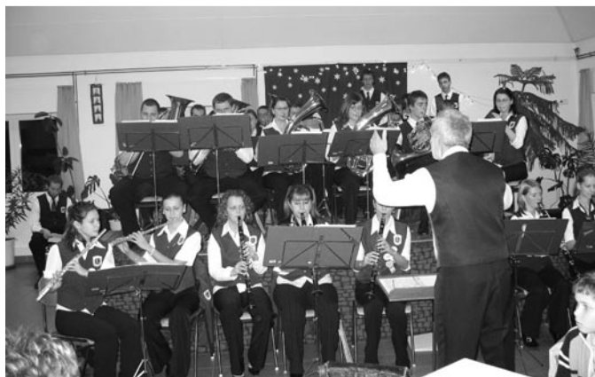
2006. december 9.