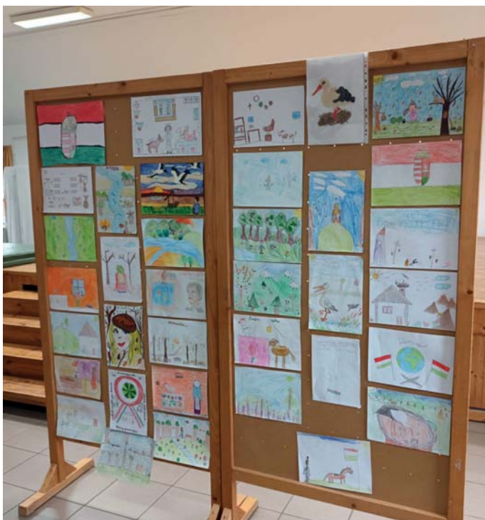
Petőfi 200 iskolai rajzpályázat