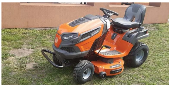
A Magyar Falu Program támogatásával vásároltuk

Az óvatos gondolkodást szem előtt tartva pályázatok segítségével fejlesztenénk tovább településünket. A Magyar Falu Programban út és járda felújításra kérünk támogatást. Amennyiben kiírásra kerül a Területi Operatív Program, úgy az óvoda bővítésre pályázunk.