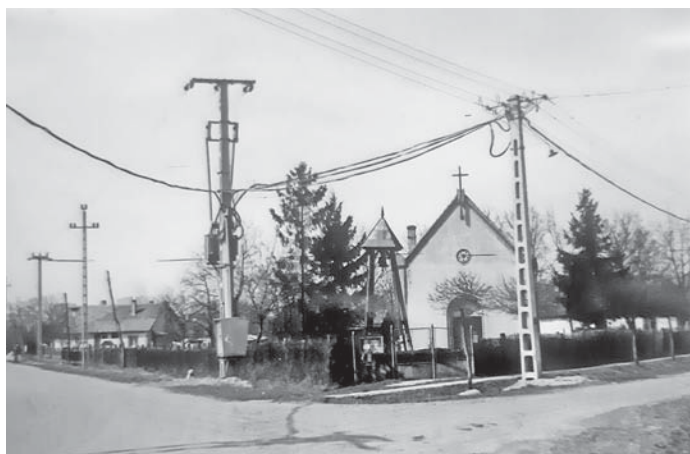
Az új Trafó