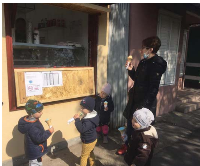
Fagyizás az új fagyizónál

A gondolatokat lejegyezte: Szabó Gáborné