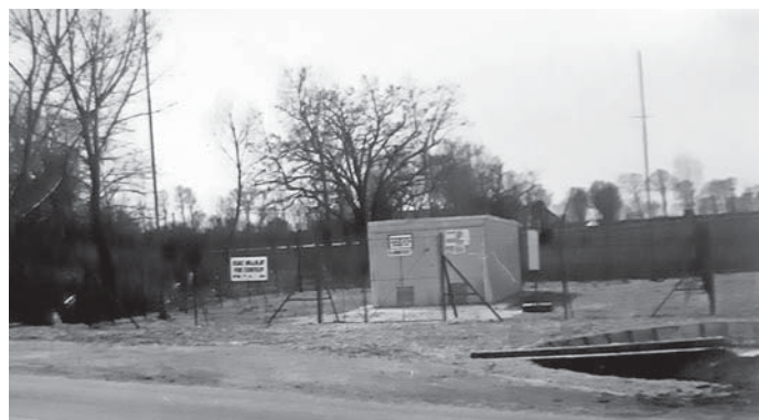
Gáz-cseretelep 1980-ban készült felvételen. Ma már nincs meg, a temető mellett volt. Ma murvás parkoló van a helyén.