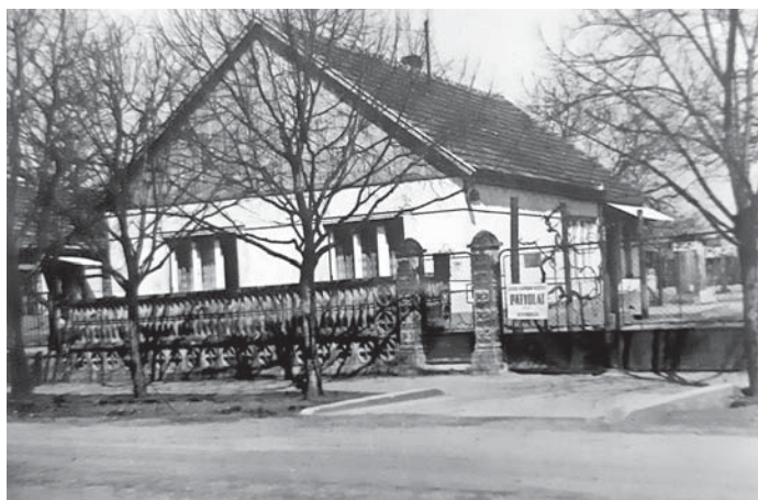
Patyolat - enesei telephely a Szabadság utcában.