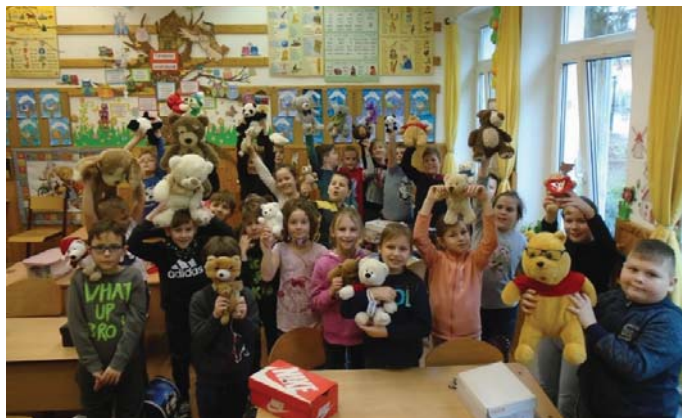
Az iskolások farsangja