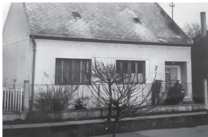
Posta – épült 1968-ban