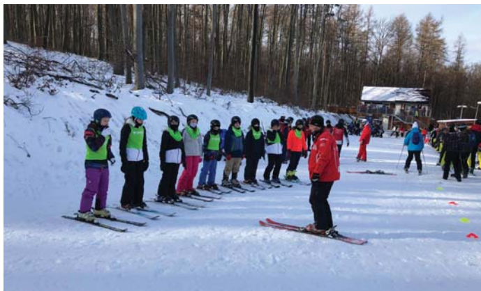
Az eplényi sípályán