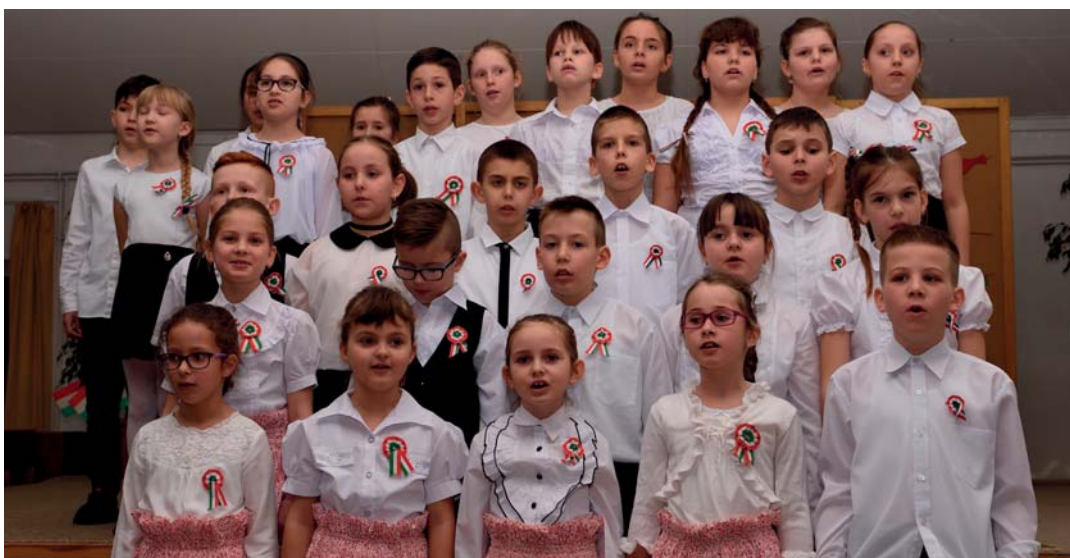
Iskolások a községi ünnepélyen március 15-én