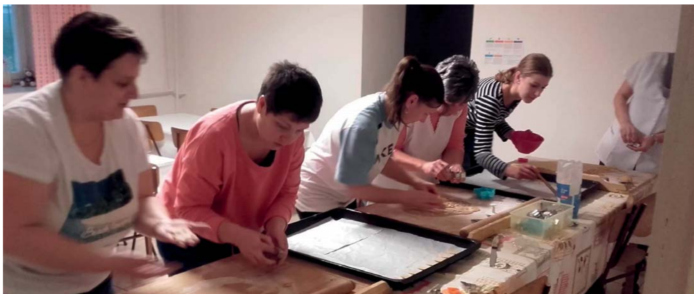
Készülnek a mézes sütik