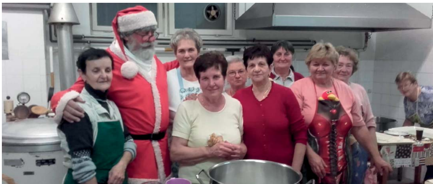
A Mikulás látogatása a szorgos sütőknél