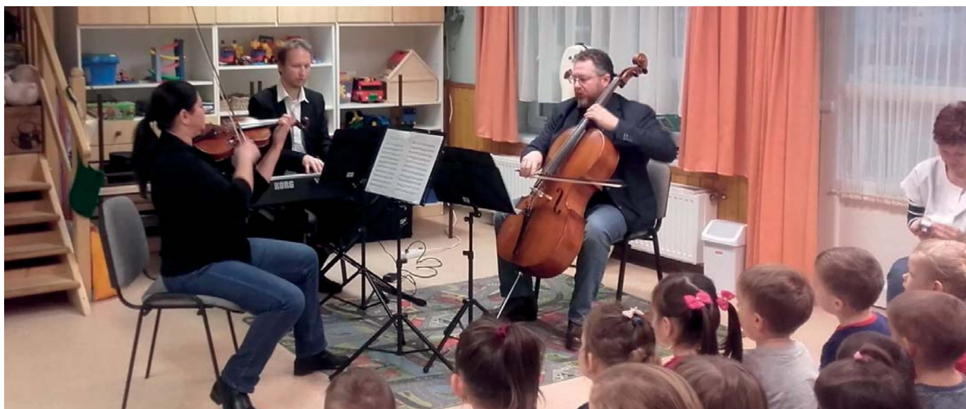
Camerata Artissima előadása