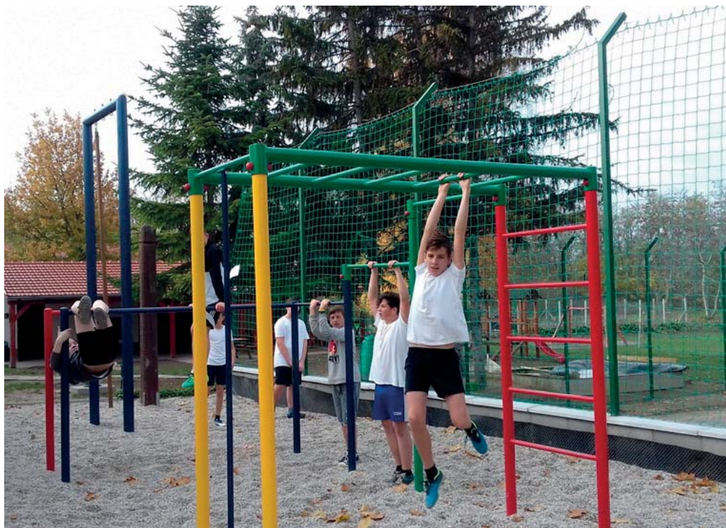
A 2017-ben átadott fitness-park

Az adventben a várakozásra hangolódást az adventi teaház indította a 8. osztályosok szervezésében. A felsős Mikulások magajándékozták az alsós tanulókat, akik a Harisnyás Pippi életével is megismerkedhettek a Holle Anyó színház előadásában. Horváth Győző visszavitt bennünket a mesék világába a régi karácsonyokhoz. Az egészséges életmódra is ügyelve, túra