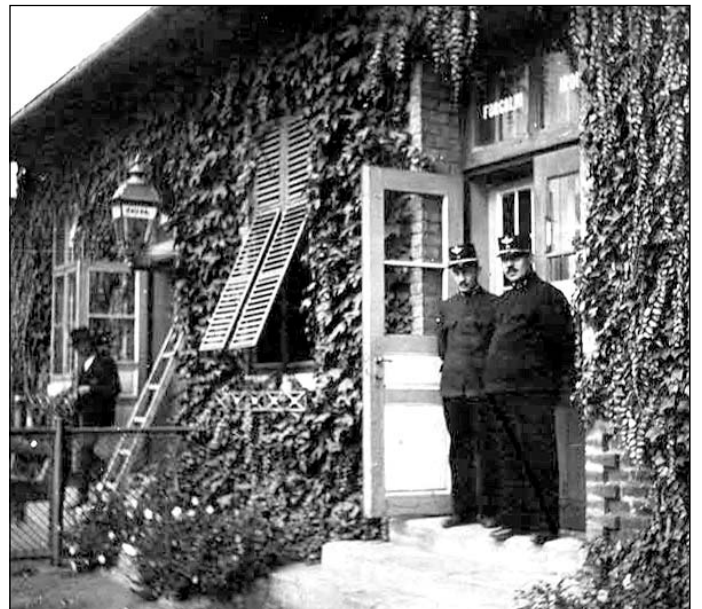
Vasúti tisztek az enesei vasútállomáson