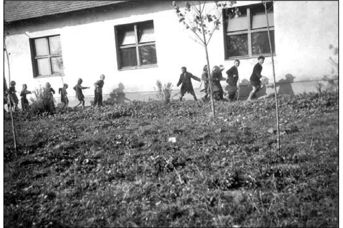
Iskolába menet Hugath pusztán