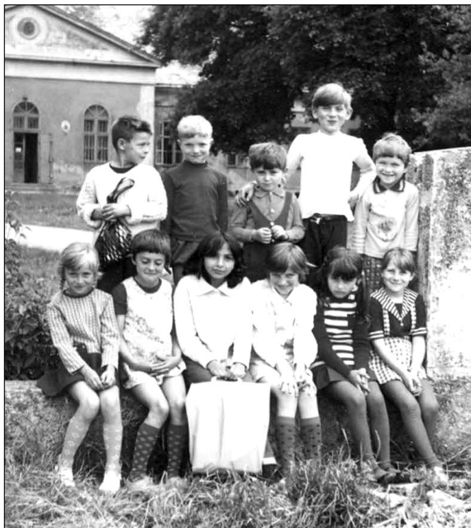
Iskolások a Péterházi kúria előtt