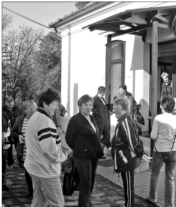
Gyülekeznek az önkéntesek a hivatal előtt