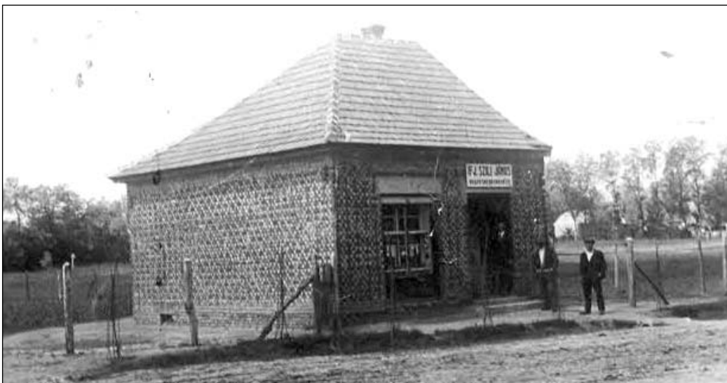
Amikor még csak a Szili bolt falai álltak a Szabadság utcában