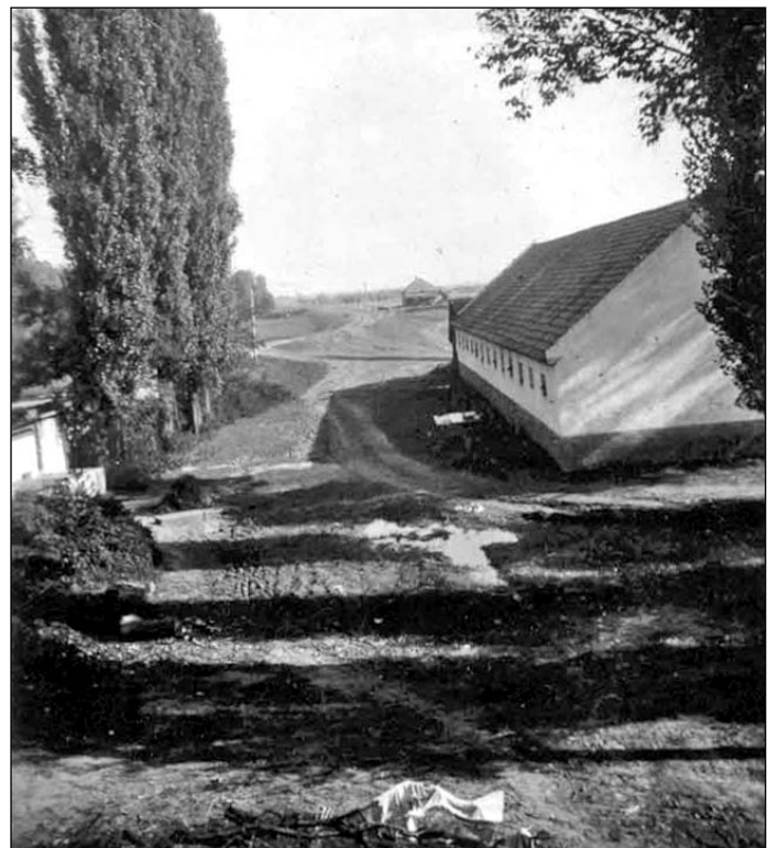
Gazdasági épület Hugath pusztán