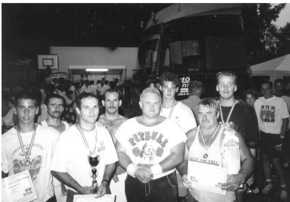
Az I. Enesei Erős Emberek versenyé – 1990-es évek közepe