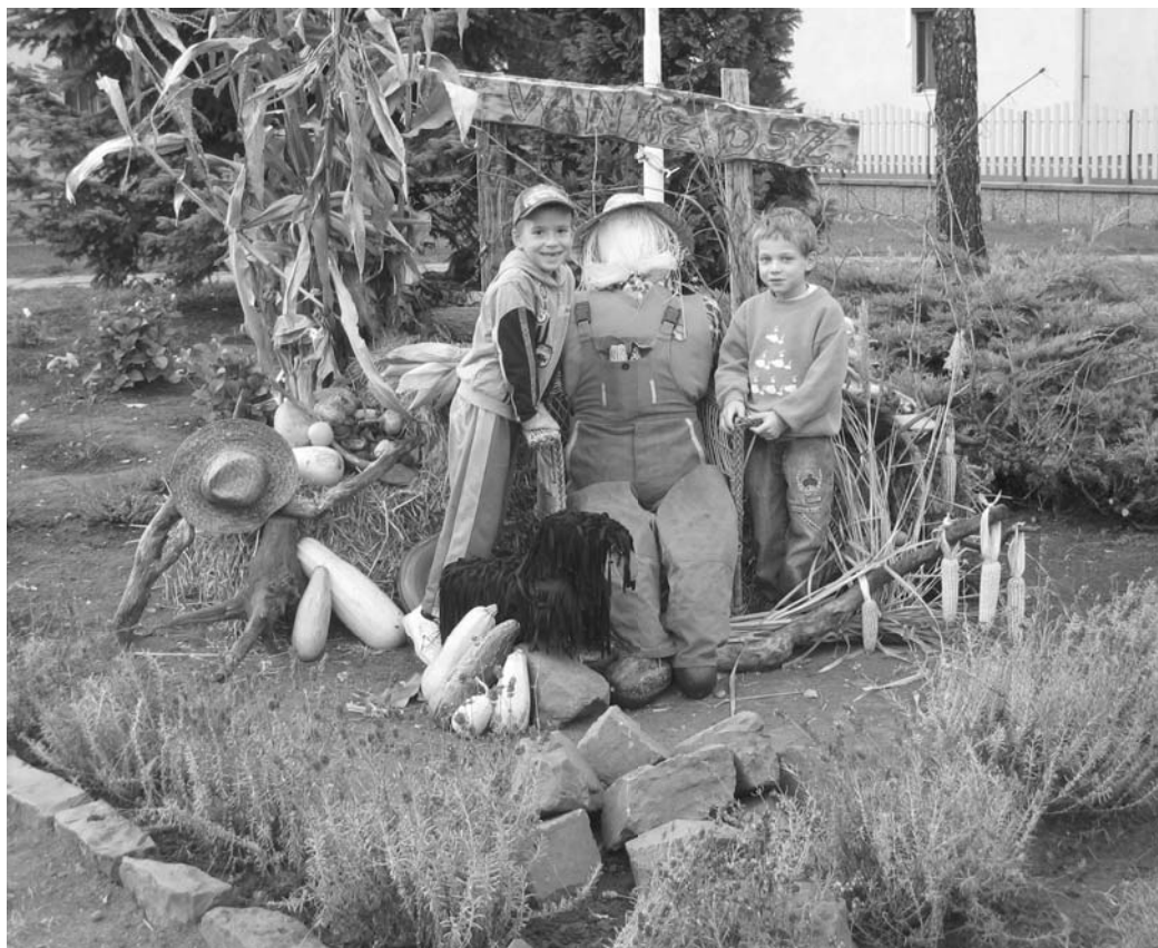
Őszi dekoráció KÖZÖN-óvodás gyerekekkel

Köszönet illeti azokat a lakosokat, akik a házuk előtt, mellett lévő területeket rendben tartják, gondozzák, fákat