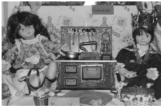
Fotók a 2009. évi enesei babakiállításról