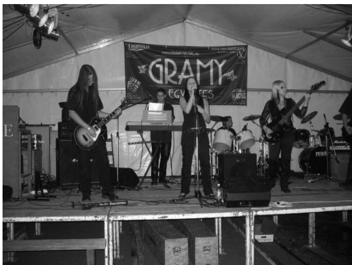
Rock-szombat községünkben 2009. augusztusának utolsó hétvégéjén