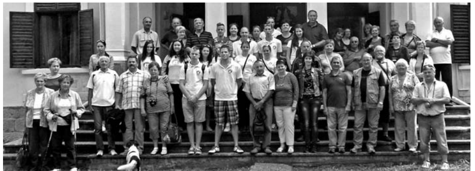
Kisbacon – Benedek Elek háza előtt

A következő nap izgalmas pillanatokat hozott együttesünknek: a Békás-szoros, valamint a Gyilkos-tó meglátogatását tűzték ki célul az enesei kirándulók. A gyönyörű környezet, a tavon való csónakázás és a hosszú séták a kirakodóvasárok között segítettek megismertetni minket a helyi különlegességével, egyediségével. A délutáni órákat minden