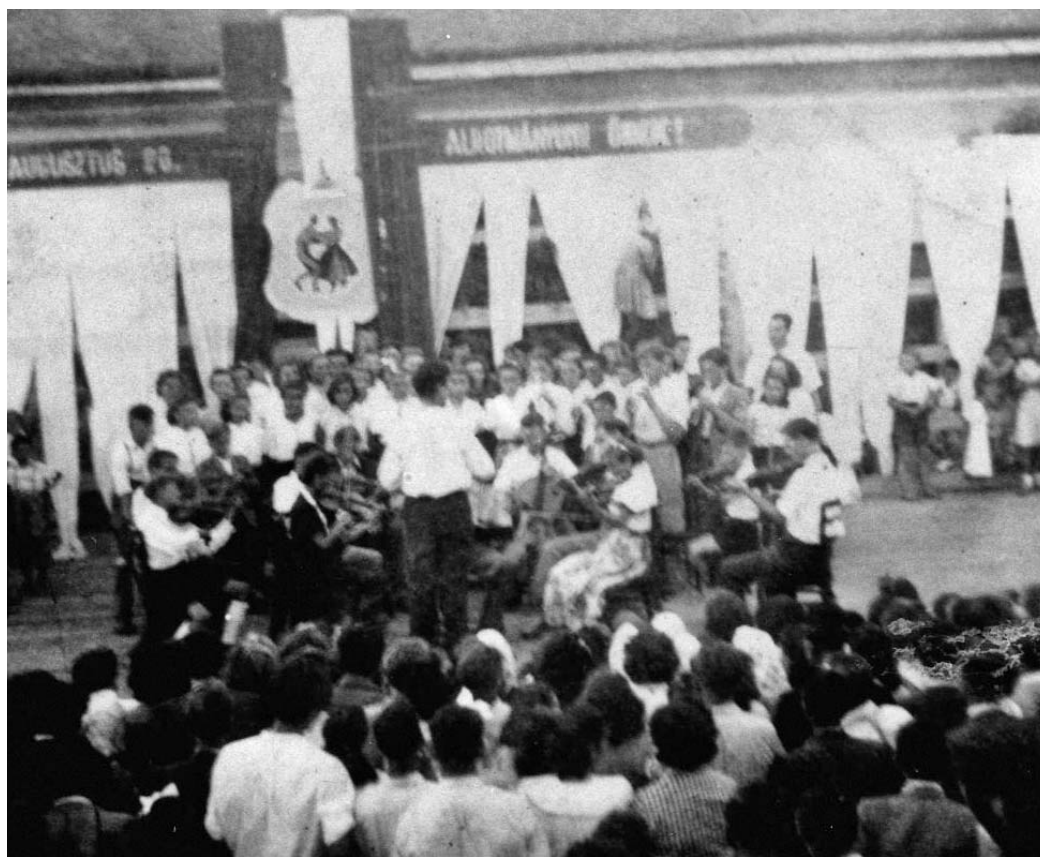
Enesei kórus 1953-ban

Én Győrben a Révai gimnáziumban érettségiztem.