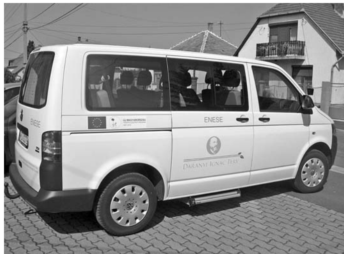
Falubusz – pályázaton nyertük

Több éve szeretnénk volna a faluközpontot újjávarázsolni. Egy Leader-es pályázatnak köszönhetően készült el 2011-ben a pihenőpark a Közön –kis csobogóval, padokkal. Községünk dísz, kellemes színtöltje lett. Szintén pályázati pénzből valósítottuk meg a régóta tervezett és várt beru-