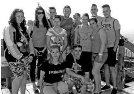
Magos Déva várában

Alig, hogy véget ért júniusban a Hagyományok Napja, kis csapatunk már nagyon várta, hogy elkezdhessen készülni az egy hetes útra. Mivel a csoport tagjai közül többen is jártunk már testvérközségünk, Csíkszentmihály településén, ezért biztosak voltunk benne, hogy ez a kirándulás is felejthetetlen lesz.