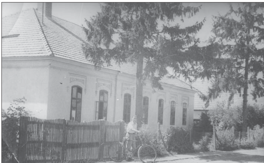
A Hivatal – a kapu előtt Ihász Ferenc tanácselnök biciklivel