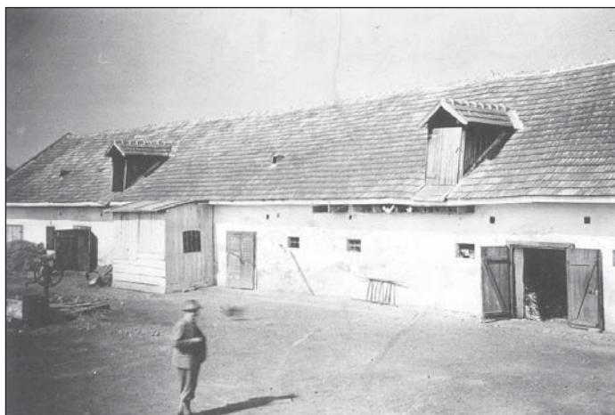
Gazdasági épületek, lebontásra kerültek