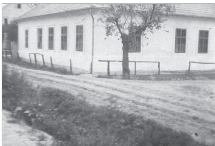
Az épület egy másik felvételen, háttérben a magtár