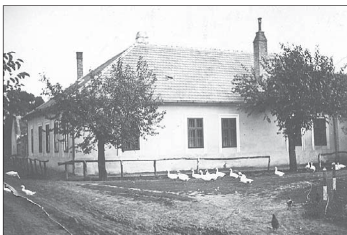
Korn kúria és a Köz, előtérben libákkal